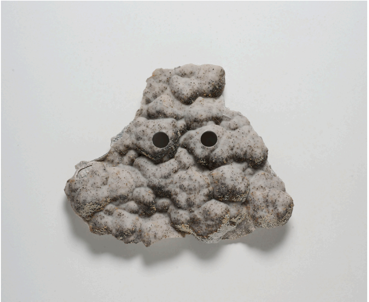
Evariste Richer, Masque à faire tomber la neige #1 , 2010

Merci de respecter et de mentionner les légendes et les crédits photos lors des reproductions