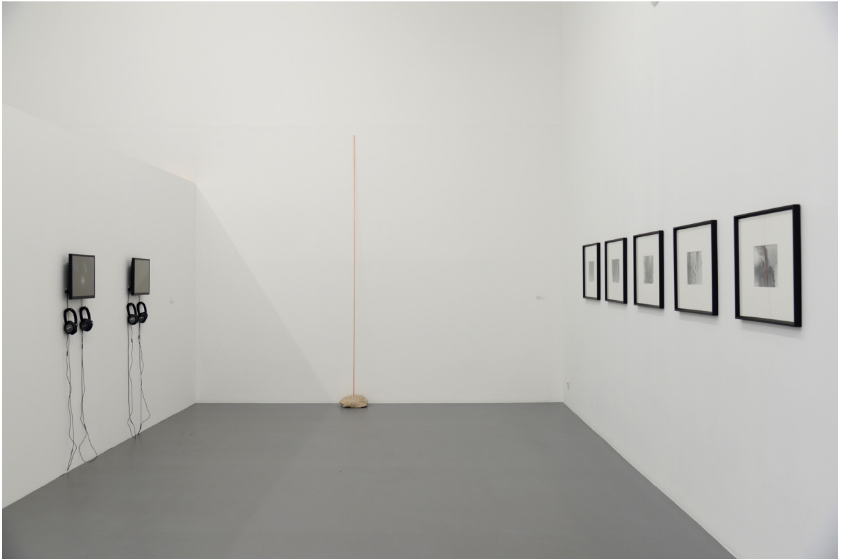
vue de l'exposition Personne, pas même la pluie, n'a de si petites mains , La Criée centre d'art contemporain, Rennes, 2019

Merci de respecter et de mentionner les légendes et les crédits photos lors des reproductions