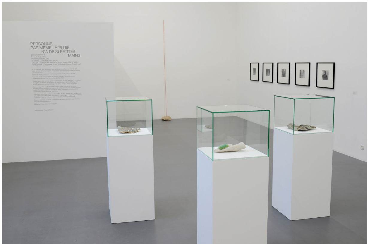
vue de l'exposition Personne, pas même la pluie, n'a de si petites mains , La Criée centre d'art contemporain, Rennes, 2019

Merci de respecter et de mentionner les légendes et les crédits photos lors des reproductions