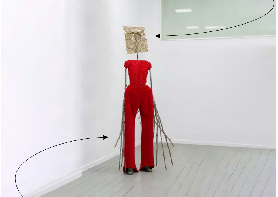
Omnia la reine