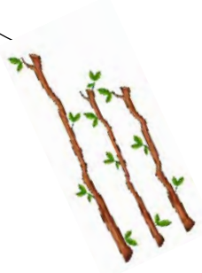
Petites branches d'arbre