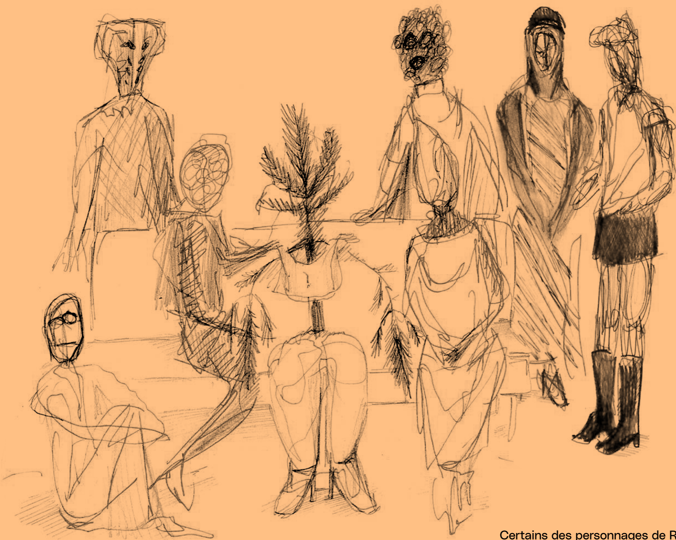
Certains des personnages de Rasmus se sont rassemblés autour d'un canapé. Colorie-les et imagine les histoires qu'ils se racontent en écrivant dans les bulles !