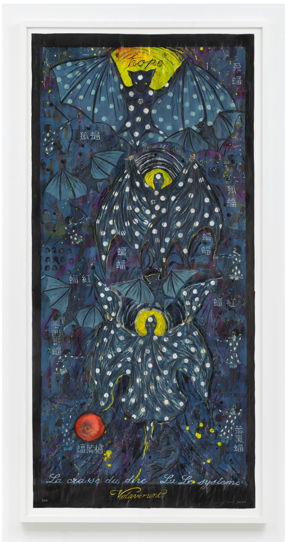
I'll Sleep on the Earth And I'll Fly Once I Wake 2018

aquarelle, encre et graphite sur papier, 192,4 × 90,2 cm © Marcel Dzama courtesy de l'artiste et Sies+Höke