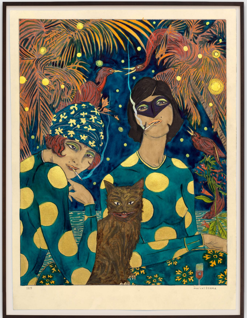
Before I let you take me home (or Lets go for drinks), 2024

acrylique nacré, encre, aquarelle et graphite sur papier, 53,5 × 40,4 cm