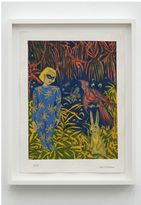
✕ Under a dream in open air , 2022, gouache, aquarelle, encre et graphite sur papier, 31 x 23 cm © Marcel Dzama, courtesy de l'artiste et Sies+Höke