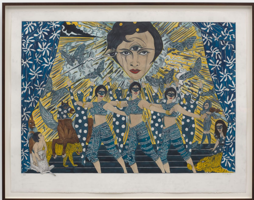
✕ All the youth come out to play ain't no one lay in our way , 2019

gouache, encre et graphite sur papier, 97,2 x 126,4 cm © Marcel Dzama, courtesies de l'artiste et David Zwirner