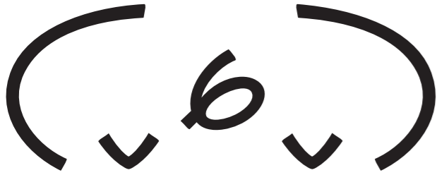
Carte de jeux

Bienvenue dans l'exposition Pharmakon / Reboot de Violaine Lochu.