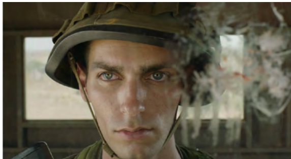
Ali Cherri, The Watchman , 2023

Le songe d'une nuit sans rêve (Dreamless Night) is the first solo exhibition by Ali Cherri, a Lebanese artist living in Paris, in an art institution in France.