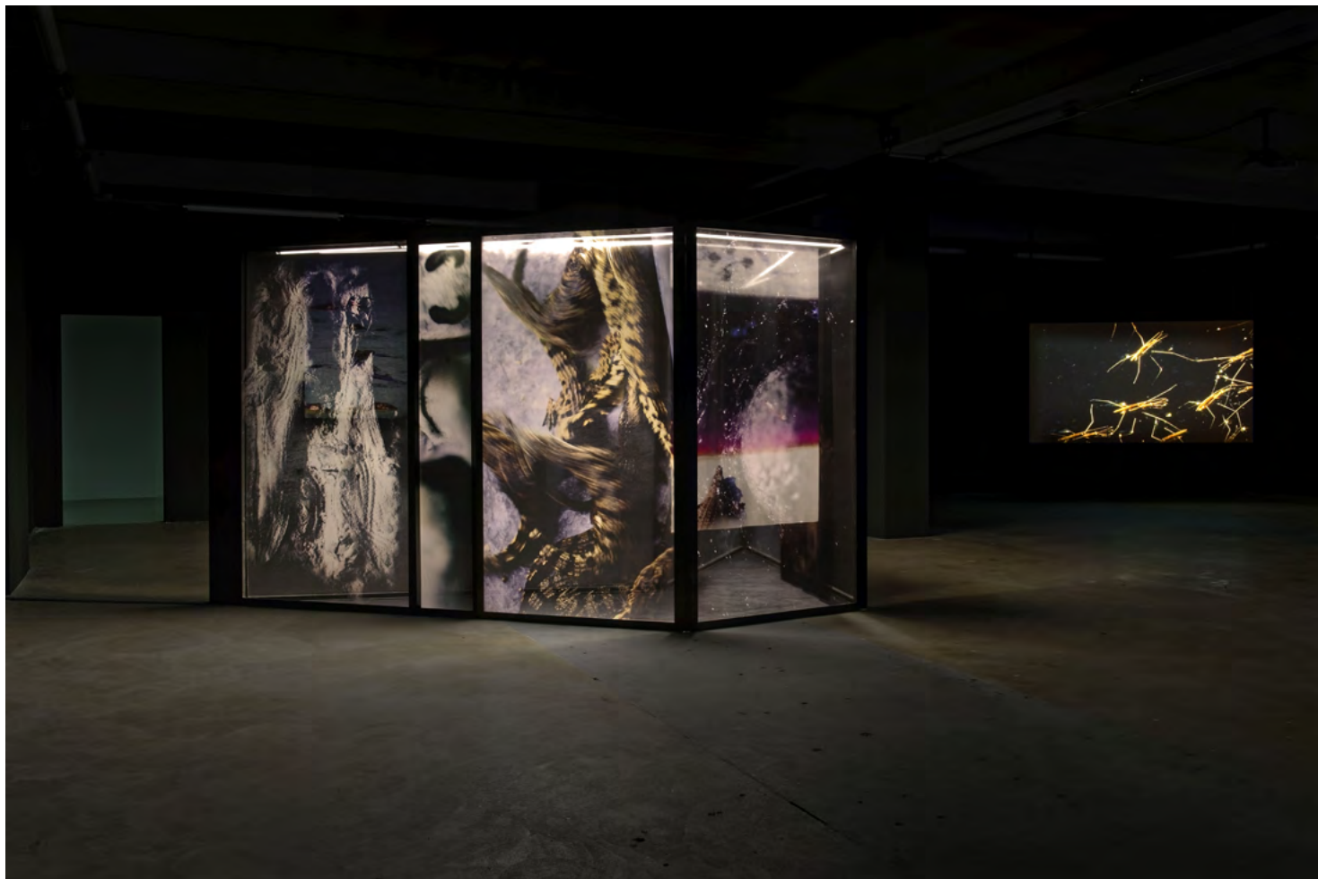
Anne-Charlotte Finel, Passagers , 2022

Steel structure, satin, wooden frame and silk organza covering, 210 × 270 × 290 cm video HD, music : Voiski production and collection LVMH Métier d'art